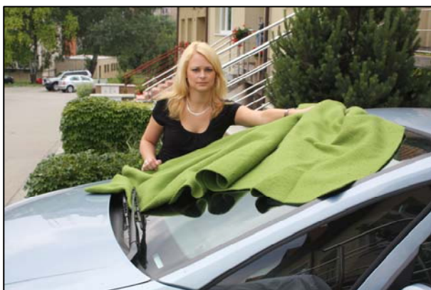
Obr. 6: Chraňte okna automobilu.