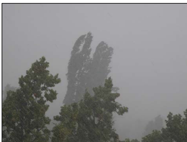
Obr. 7: Bouřka doprovázená přivalovými dešti.

stromy nebo v blízkosti vodivých předmětů. Při bouřce netelefonujte. Pokuste se najít chráněné místo v níže položeném prostoru (údolí, úpatí kopce) s nižší vegetací, dostatečně daleko od stožárů a vedení el. proudu. Vyčkejte do konce bouřky. Vzdálenost bouřky poznáte podle časového rozmezí mezi zábleskem a zahřměním. Pro přibližný odhad platí, že počet sekund mezi zábleskem a zahřměním vydělte třemi a získáte počet kilometrů, jak daleko od Vás je bouřka. Neopouštějte úkryt,