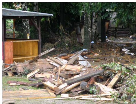
Obr. 2: Následky vichřice.

Bouřka – největší riziko představují blesky, které mohou při přímém zásahu způsobit smrt nebo těžké zranění (popálení) a také požár porostu nebo obytných budov. Dalším nebezpečím jsou možné poryvy větru (pády stromů, sloupů nebo drátů el. vedení, částí budov nebo převrácení automobilů).