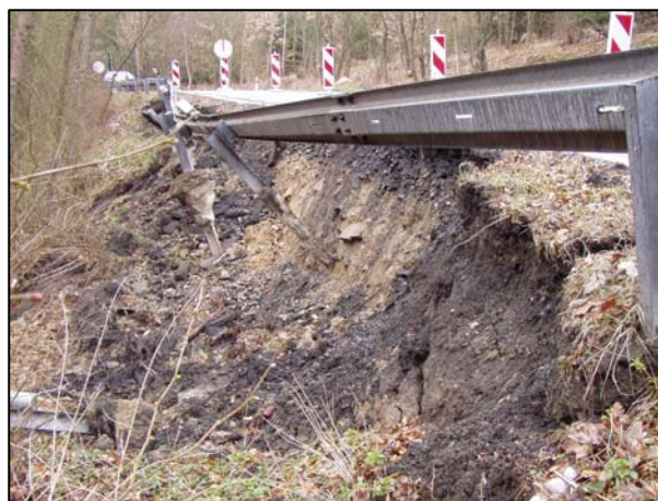
Obr. 3: Sesuvy půdy způsobené přívalovými dešti.

Přívalový déšť - těžko předvídatelný intenzivní déšť (nemusí být doprovázený bouřkou) s následkem náhlého zaplavení sklepů obytných domů, komunikací, ucpání kanalizace a úzkých profilů mostů bahnem, listím apod., eroze na nezpevněných cestách a také polích a zahradách, sesuvů půdy, protržení hrází rybníků, odplavení a poškození nedostatečně upevněných předmětů, poškození břehů vodních toků.