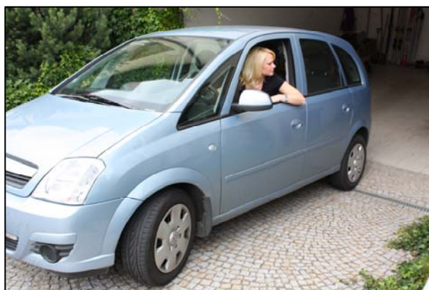
Obr. 8: Zaparkujte auto do garáže.

Ve všech případech je třeba dobře vyhodnotit situaci . Při blížícím se klimatickém jevu je bezpečnější rychlý únik , pokud jste již daným jevem zasaženi, jedte velmi pomalu nebo zastavte na bezpečném místě , kde nehrozí zejména pád stromů nebo srážka s jiným vozidlem při zhoršené viditelnosti. Dále: