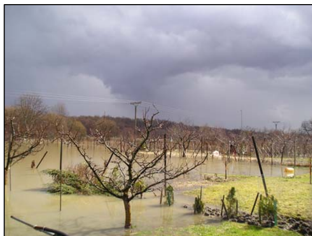
Obr. 1: Extrémní projevy počasí.

systém informování občanů (nejen) o hrozícím nebezpečí pomocí bezplatných SMS zpráv , stačí se jen zaregistrovat na Vašem obecním úřadě. Podobný systém provozuje i Krajský úřad Jm kraje.